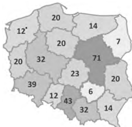
Liczba uniwersytetów trzeciego wieku w Polsce w poszczególnych województwach

* Liczby oznaczają ilość UTW w Polsce w poszczególnych województwach Stan na dzień: 19 marca 2012 r.