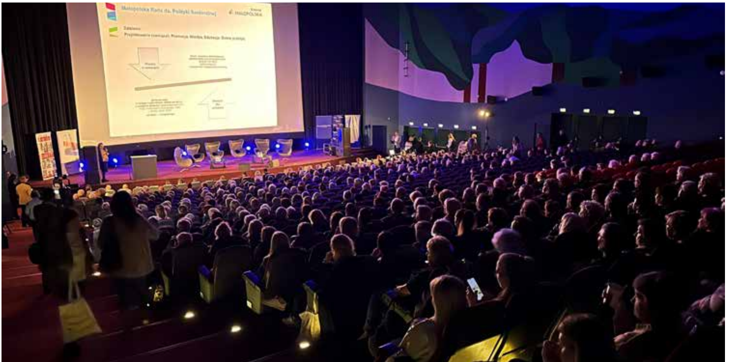
↑ VI Małopolski Kongres Srebrnej Gospodarki

ka, co należy zmienić w przestrzeni publicznej, dlaczego warto oswoić się z Internetem i poznać możliwości, jakie on oferuje, czy warto tradycyjne planszówki zastąpić grami komputerowymi.