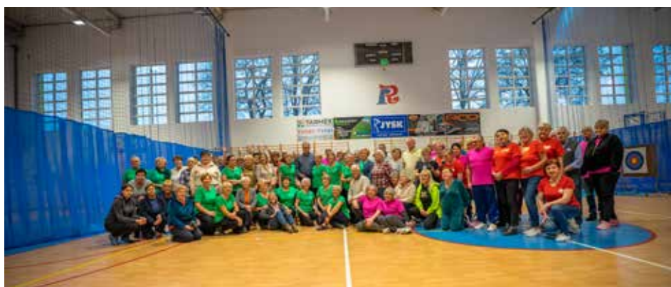
† fot. archiwum Radomszczański UTW „Wiem więcej”

Grupa taneczna Ladies and Gentleman RUTW „Wiem więcej” zatańczyła pięknego fokstrotą w stylowych strojach i romantyczne „Kawiarenki”. Do tańca zaproszono wszystkich uczestników turnieju. Sekcja gimnastyczna zaprezentowała żywiolowy pokaz z pomponami, do którego również przyłączyli się zawodnicy i goście imprezy, łącznie z Prezydentem Radomska. Celem imprezy było stworzenie więzi międzypokoleniowej wokół idei sportowej rywalizacji oraz propagowanie zdrowego i ak-