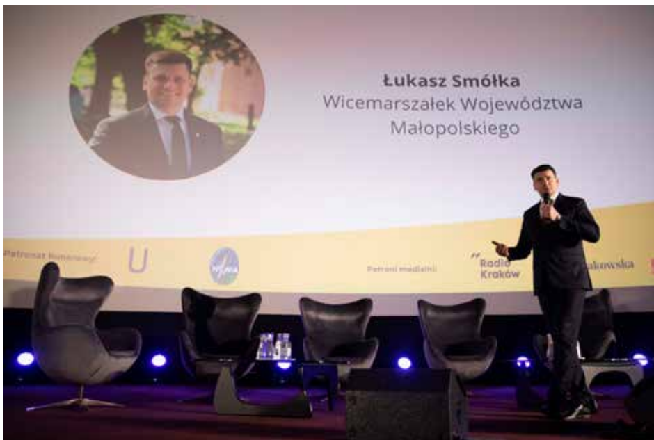
VI Małopolski Kongres Srebrnej Gospodarki

Zaprezentowano także „Dzienniczek lekowy” opracowany przez ekspertów-lekarzy geriatrici, w którym seniorzy będą mogli zapisywać przyjmowane leki, aby w czasie wizyty u lekarza mogli przedłożyć informacje o zestawie przyjmowanych farmaceutyków.