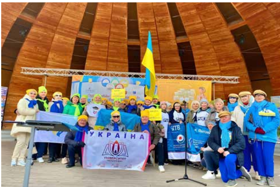
Reprezentacja Ukraińskich UTW

Seniorzy Uniwersytetu Trzeciego Wieku w Łucku od wielu lat