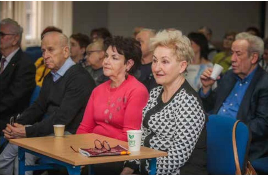
Duże zainteresowanie słuchaczy OUTW