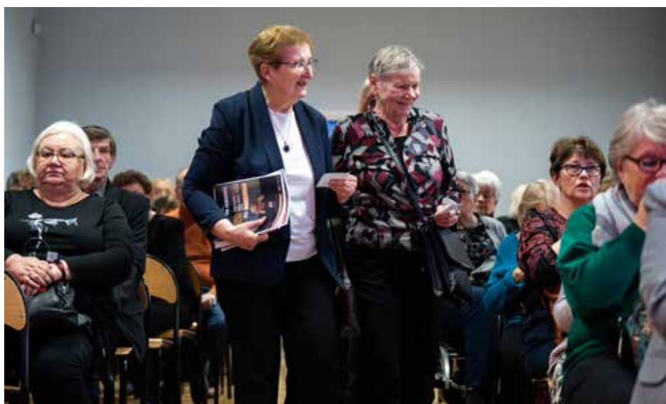
Stuchacze i goście podczas Inauguracji UTW Gmina Krzeszowice