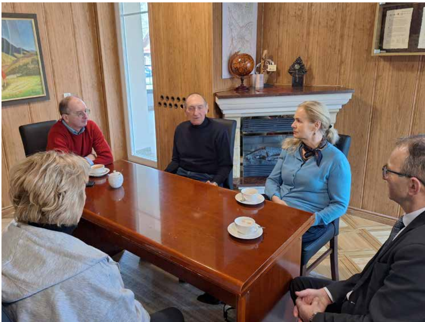
Uczestnicy spotkania w Urzędzie Miejskim w Rabce-Zdroju

raz szersze kręgi oraz mobilizować amatorów zimowych sportów do szlifowania formy na następne lata.