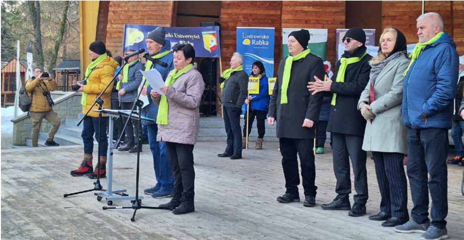
Uroczystość inauguracji Senioriady

niony przez decydentów. Po zakończeniu Senioriady organizatorzy podsumowują to spotkanie i przekazują informację o jej przebiegu.