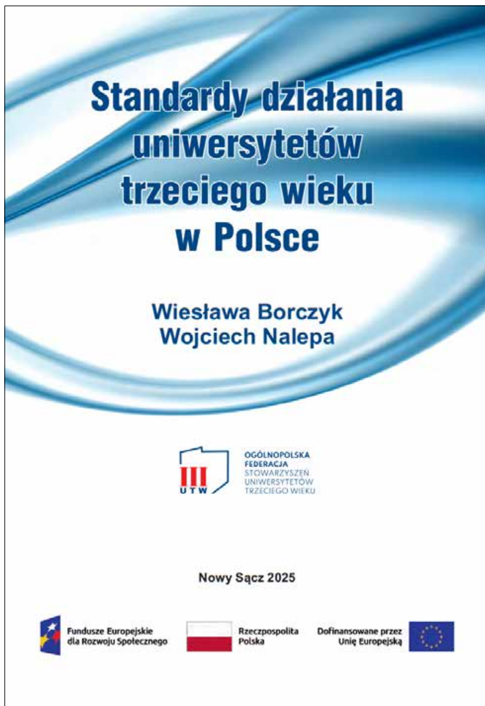
Najnowsze wydanie „Standardów działania uniwersytetów trzeciego wieku w Polsce”

go Wieku formułującego zbiór rekomendowanych standardów działania tej grupy NGOów w obszarze prawnym, merytorycznym i organizacyjnym, któ-