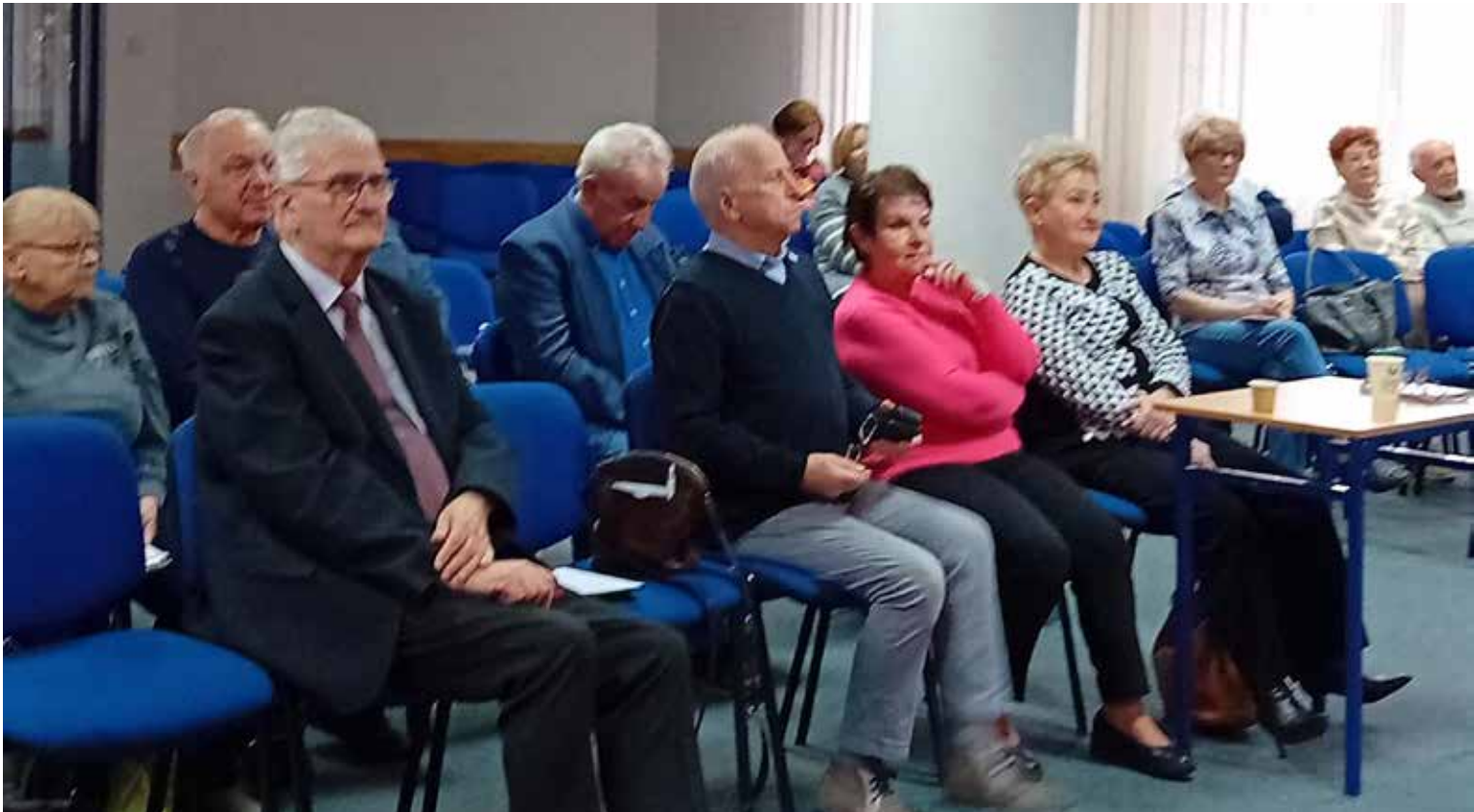
Byliśmy w auli SAN, fot. Anna Kłopocka

spotkania się z tak licznym gronem seniorów ze środowiska uniwersyteckiego, a także podziw dla ich postawy życiowej, dążenia do poszerzania wiedzy oraz swoich zainteresowań i umiejętności; do poznawania rzeczy nowych. „ To dla mnie zaszczyt spotkać się z tak wyjątkowymi ludźmi, dzielić wiedzę niezbędną dla rozwoju miasta, wysłuchać ich racji, pomysłów i propozycji. To nasz wspólny interes ” – mówił Wiceprezydent.