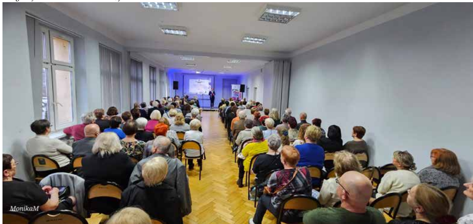
Inauguracja UTW Gmina Krzeszowice

32-065 Krzeszowice, ul. Grunwaldzka 184 tel: 88 77 44 444, biuro@utw-krzeszowice.pl utw-krzeszowice.pl