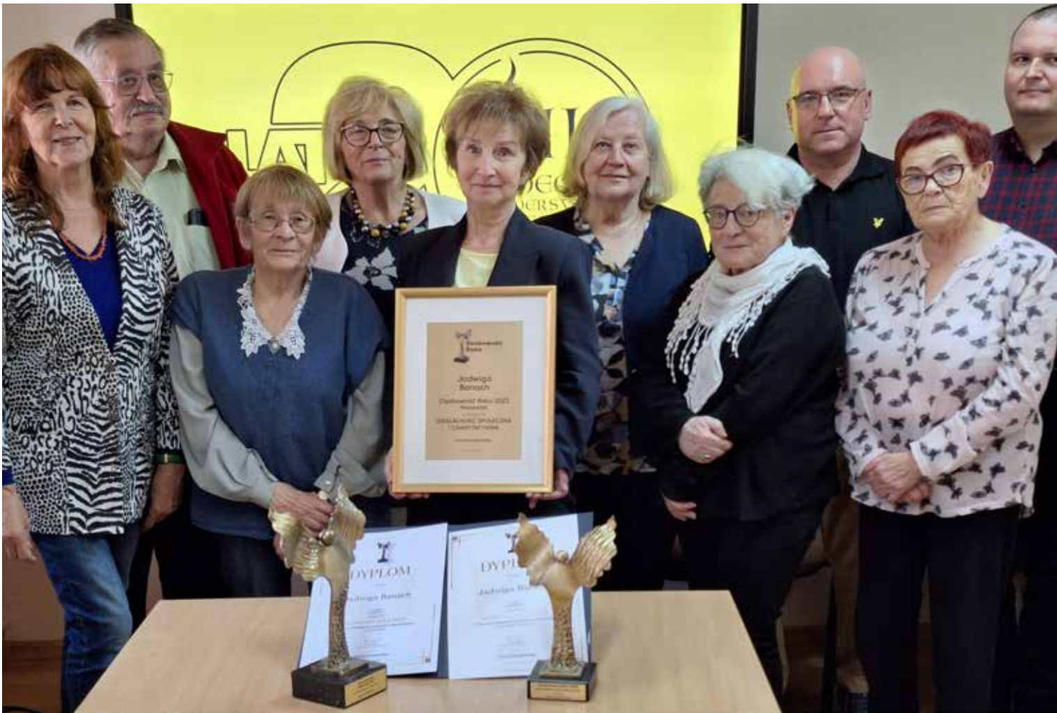
Członkowie zespołu redakcyjnego Biuletynu Sądeckiego UTW