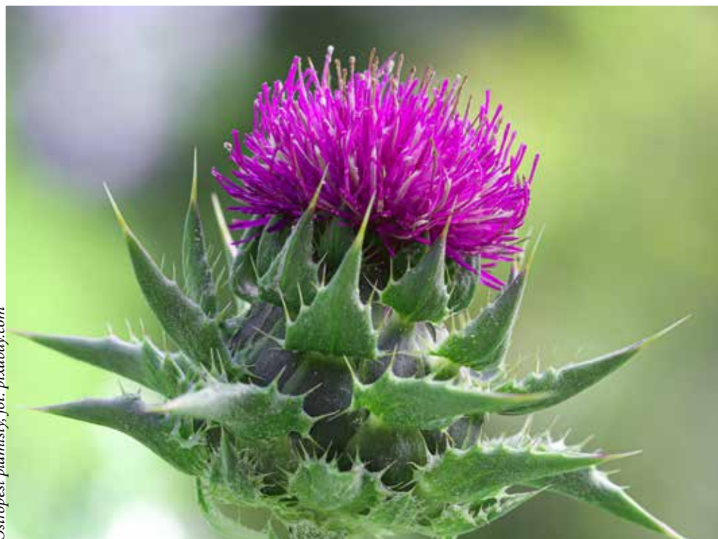
Ostropest plamisty

Ważne jest nawadnianie organizmu, aktywność fizyczna, odpowiednia ilość snu oraz dbanie