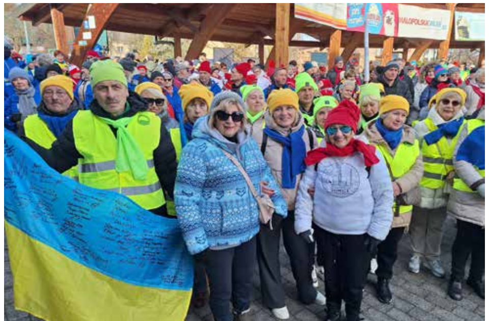
Reprezentacja Ukraińskich UTW

Uczestnicy są bardzo zadowoleni z wyników projektu. Pracujemy dalej.