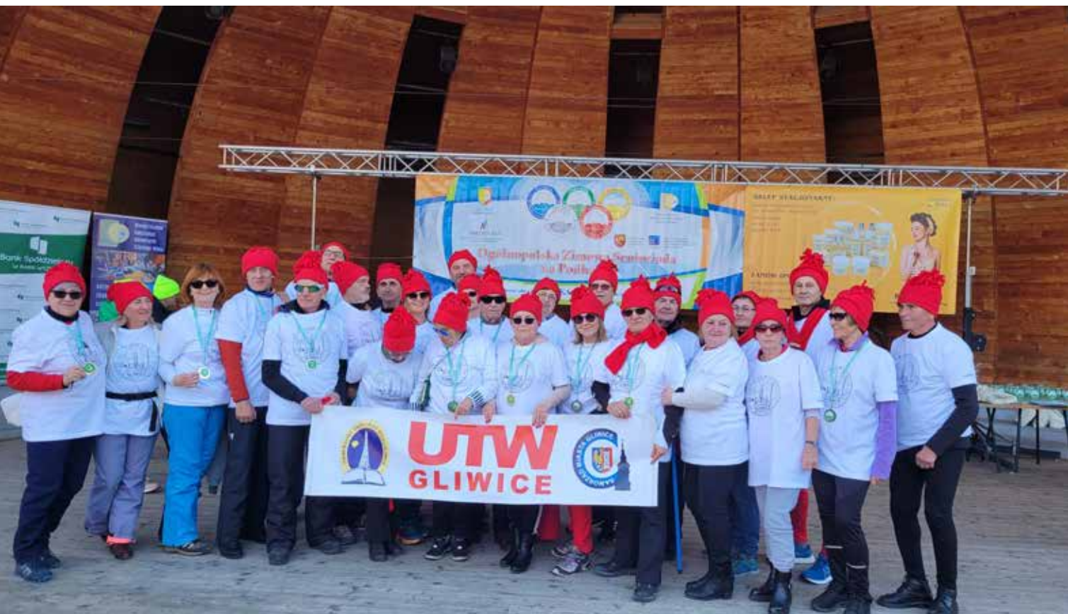
Reprezentacja UTW Gliwice, fot. archiwum UTW Gliwice

mogli się zrelaksować i nabrać sił do kolejnych sportowych wyzwań. Wśród zawodników są osoby w wieku od 60+ do 90+, którzy chętnie trenują i biorą czynny udział w zawodach. Jak widać na powyższych przykładach, w każdym wieku warto zacząć uprawiać sport i odnosić sukcesy, tylko trzeba chcieć. Nasi seniorzy są żywą reklamą naszego miasta Gliwice.