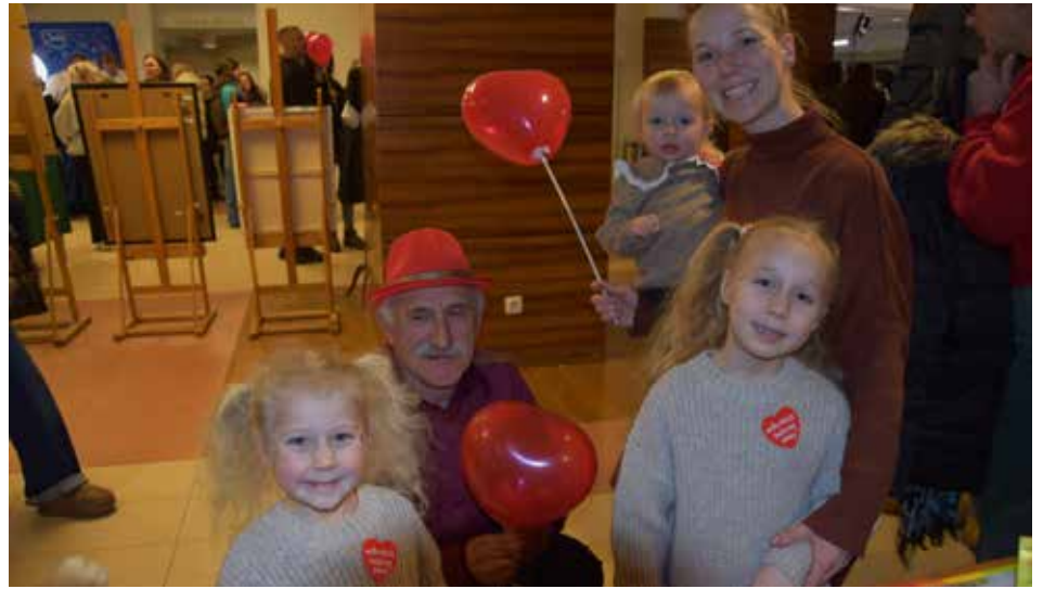
fot. Anna Kłopocka, Barbara Peukert