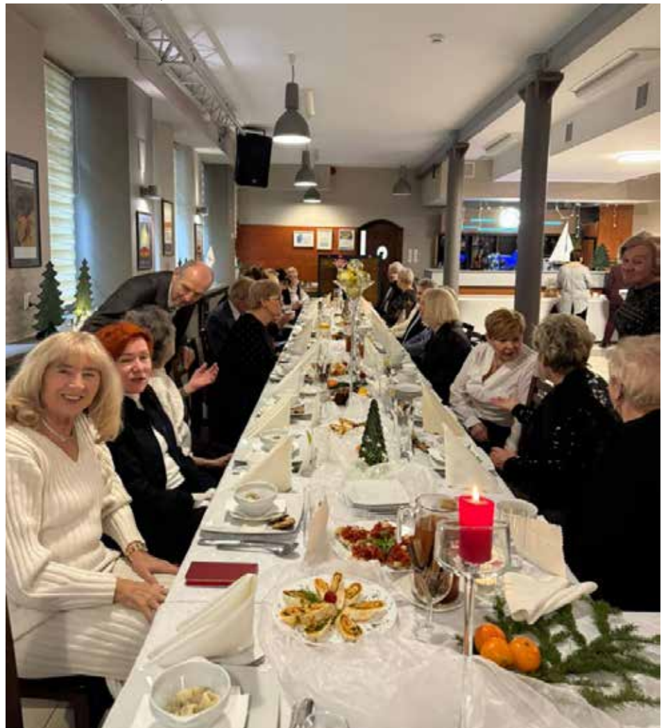
fot. Słuchacze Morskiego Uniwersytetu Trzeciego Wieku podczas spotkania wigilijnego w Klubie Pod Masztami, archiwum MUTW w PM w Szczecinie

Słuchacze MUTW aktywnie uczestniczą również w licznych wydarzeniach społecznych i kulturalnych. Wśród nich znajdują się spotkania okolicznościowe, takie jak wigilia, spotkania wielkanocne czy noworoczne, a także wydarzenia związane ze świętem uczelni. Organizowane są także wizyty w instytucjach publicznych, między innymi w Urzędzie Miasta Szczecin oraz w Urzędzie Marszałkowskim Województwa Zachodniopomorskiego. Seniorzy chętnie uczestniczą również w wydarzeniach związanych